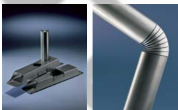
Anwendungsbeispiele aus der Praxis